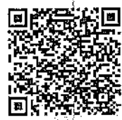
Total a pagar