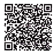
Total a pagar